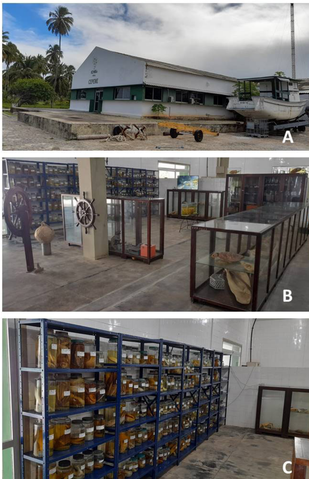
Figura 1 – A - Prédio da pesquisa no CEPENE; B - Salão de exposição da coleção no prédio da pesquisa; C - Coleção Biológica do CEPENE via úmida.

os lotes novos incorporados à coleção continuam sendo registrados manualmente, através de livros de tombo e, concomitantemente, ao BDI.