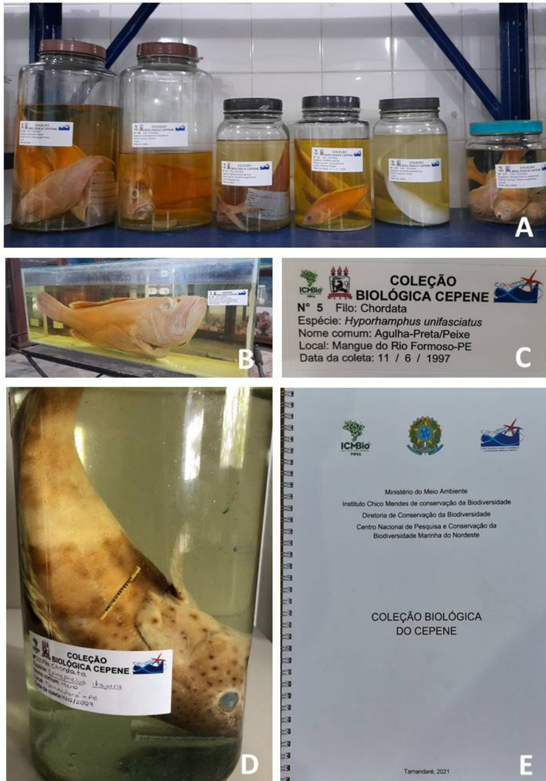
Figura 2 – A - Lotes da Coleção Biológica do CEPENE via úmida; B - Maior exemplar da coleção Epinephelus niveatus (cherne-verdadeiro) [CBC n° 297]; C - Modelo de etiqueta utilizada na coleção; D - Exemplar de Mero Epinephelus itajara (mero) [CBC n° 355]; E - Capa do livro de tombo, criado em 2021.