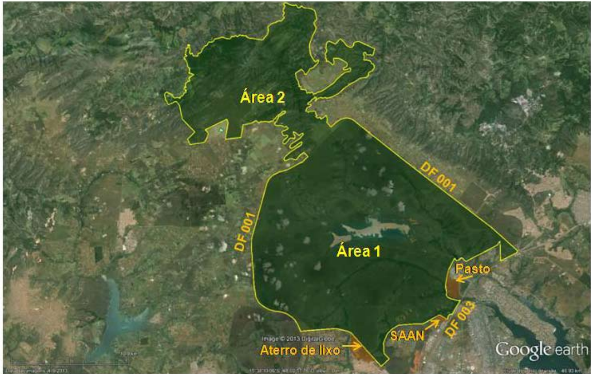
Figura 1 – Imagem de Satélite com o Parna de Brasília e suas Áreas 1 e 2. Destaque para o aterro de lixo da Estrutural, o Setor de Armazenamento e Abastecimento Norte (SAAN), o pasto e as rodovias DF001 e DF003.

com cerca de 30.000 hectares. Com a Lei nº 11.285/06, o Parque teve seus limites redefinidos e ampliados para 41.300 ha. A nova poligonal incluiu a região do vale do rio da Palma e dos ribeirões Dois Irmãos e Cupim e é reconhecida como Área 2 (Figura 1).