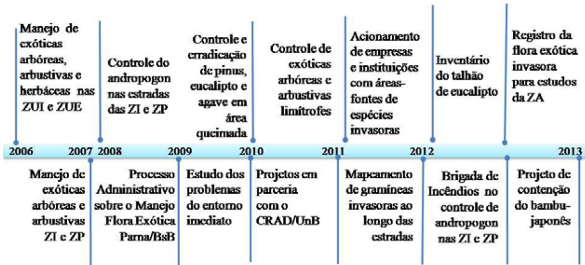
Figura 3 – Linha do tempo com as principais ações de manejo da flora exótica no Parque Nacional de Brasília (período 2006 – 2012). As siglas são: Zona Intangível/ZI; Zona Primitiva/ZP; Unidade de Conservação/UC; Centro de Referência em Recuperação de Áreas Degradadas da Universidade de Brasília/CRAD/UnB e Zona de Amortecimento/ZA.