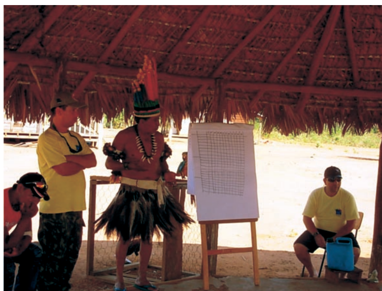
Figura 2 – Momento de construção participativa do quadro de impacto dos incêndios na fauna e flora (Terra Indígena Paresi).

A definição do período do ano para a realização das queimadas exigiu uma abordagem mais complexa, uma vez que os diferentes objetivos de uso do fogo resultaram em períodos de aplicação conflituosos. Desta forma, constatado que o principal objetivo do manejo era evitar o comportamento extremo dos incêndios e seus efeitos negativos sobre os recursos naturais considerados importantes, foi elaborado um quadro de impactos. Foram listados os animais e as plantas considerados importantes na horizontal e os meses do ano na vertical (Figura 2). A partir deste quadro, foram definidos os meses em que estes recursos sofrem os maiores impactos negativos pela ação do fogo (períodos reprodutivos como floração, frutificação, parto, nidificação