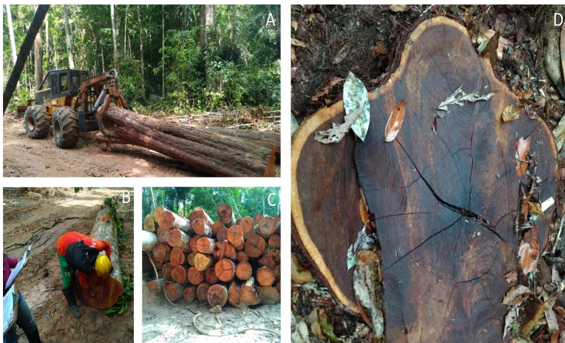
Figura 1 – Ilustrações de algumas etapas do manejo florestal: A – arraste de tora de madeira por trator florestal até o pátio de estocagem; B – medição rigorosa e marcação das toras para posterior controle da cadeia de custódia da madeira; C – toras de madeira armazenadas na floresta, em pátios intermediários, para posteriormente serem levadas ao pátio central do plano de manejo florestal; D – Toco de uma árvore derrubada com seu número de identificação em plaqueta de alumínio.

A FLONA do Tapajós apresenta expressiva riqueza sociocultural, com aproximadamente 500 indígenas da Etnia Munduruku – três aldeias indígenas, a saber: Takuara, Bragança e Marituba – somados a mais de 1.050 famílias ou 4.000 moradores tradicionais, população ribeirinha, distribuídos em 23 comunidades (ICMBio, 2019). Parte dessa população – tradicionais e indígenas – constituem a COOMFLONA e realizam o MFC em uma área reservada para esse fim na UC, equivalente a menos de 15% da área total da unidade (Figuras 1 e 2).