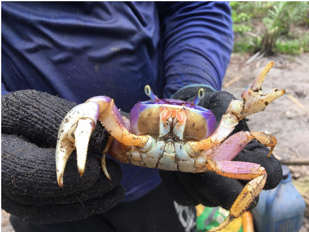
Figura 2 – Espécime macho de Cardisoma guanhumi .

foram realizadas mensalmente em dia de lua nova ou lua cheia, durante a baixa-mar, em horário diurno. Os espécimes foram capturados por pescadores utilizando armadilhas com iscas (ratoeiras).