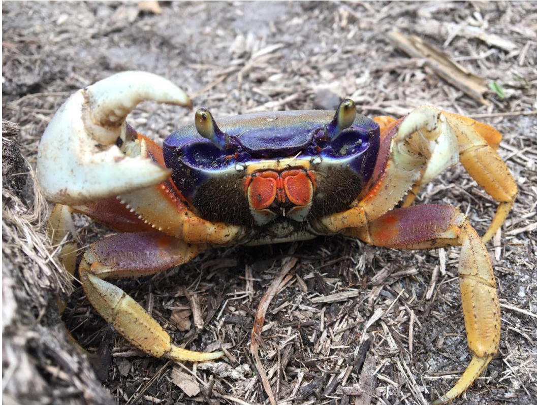
Figura 3 – Espécime fêmea de Cardisoma guanhumii .