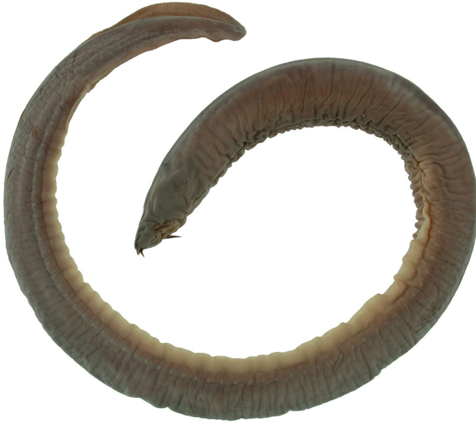
Figura 1 – Myxine australis . MNHN 1995-0471, 264 mm CT.