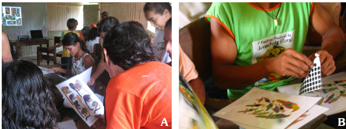
Figura 1 – Dinâmicas (A, B) para identificação dos animais cinegéticos que deverão compor o Calendário de Caça de uma dada área com a participação dos moradores.

o abate desses animais é comum entre moradores da zona rural em várias partes do mundo, seja pelo medo de ataque pessoal e/ou aos animais domésticos (ver Treves & Karanth 2003). Assim, é recomendável que sejam realizados encontros prévios com os comunitários para a definição das espécies. Em tais encontros, a adoção de dinâmicas participativas é indispensável, quando devem ser levadas ilustrações e fotografias de animais da fauna brasileira da região, tendo o cuidado de incluir também animais sabidamente inexistentes no local, como forma de avaliar a confiabilidade da fonte de informação. O procedimento consiste em organizar os moradores em pequenos grupos e solicitar que façam marcações com adesivos coloridos ou similar nas ilustrações dos animais reconhecidamente existentes e alvos de caça na região, obedecendo aos seguintes critérios: adesivo verde = animal presente e caçado na área; adesivo amarelo = animal presente, mas não caçado na área; adesivo preto = animal nunca visto na área (Figura 1). O uso de slide show com mais fotos dos animais, para auxílio na classificação das ilustrações, também é recomendado. Neste contexto, são favorecidas as particularidades regionais, o entendimento dos objetivos da realização da pesquisa, a apropriação da metodologia e a agregação e troca de conhecimentos.